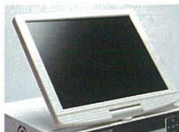
一体型10.5インチデジタル液晶