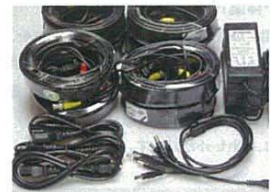
ケーブルもすべてセット!