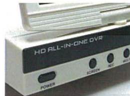
デジタルビデオレコーダー 大容量HDD 1TB!