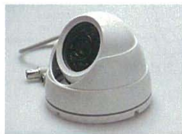
赤外線LED搭載 ドーム型カメラ